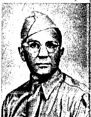
Sanstøl som instruktør i Alaska.

Allikevel tok det sin tid. Jeg satt på Ellis Island i tyve timer, og 17. mai-festen ble helt ødelagt for alle som hadde med den å gjøre.